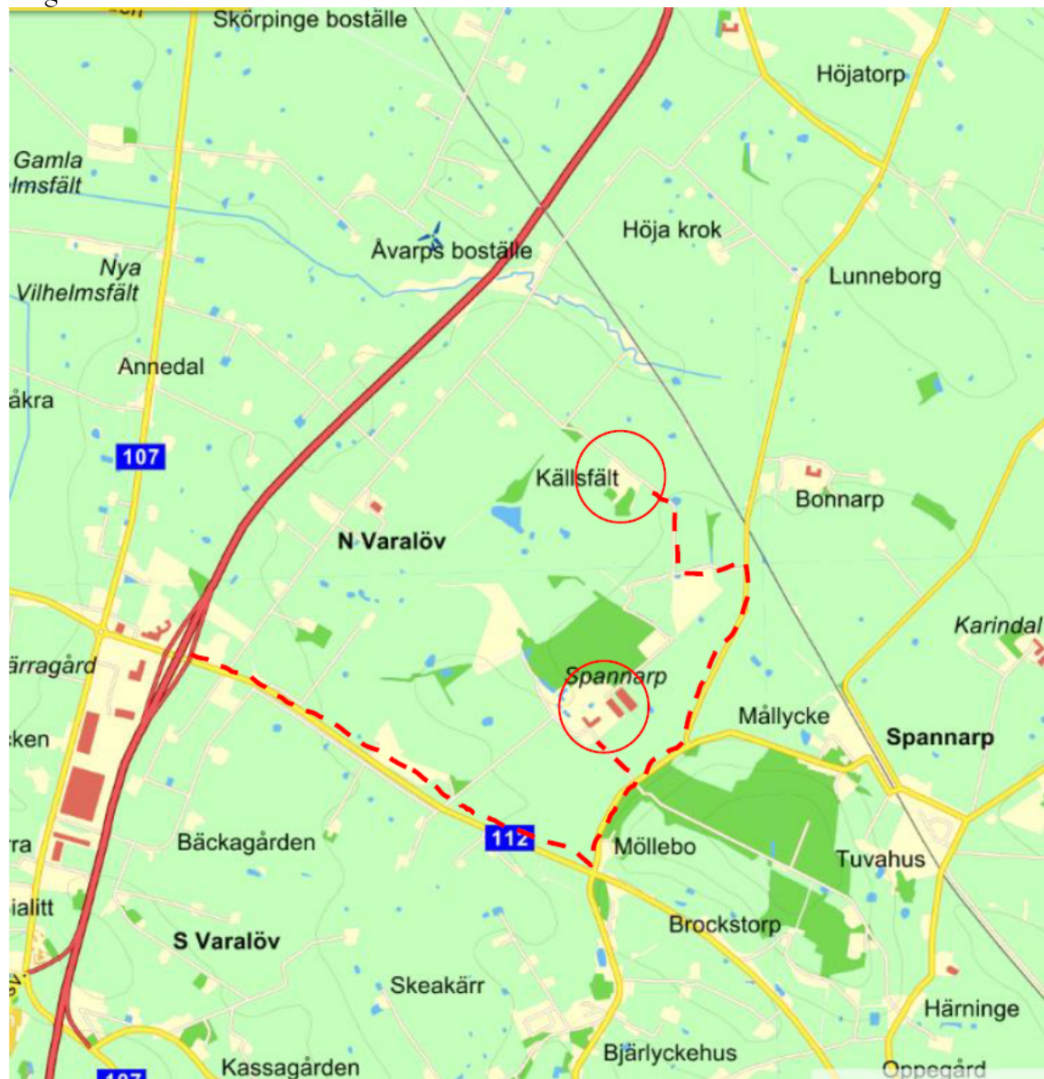
Bilaga 1. Översigtskarta