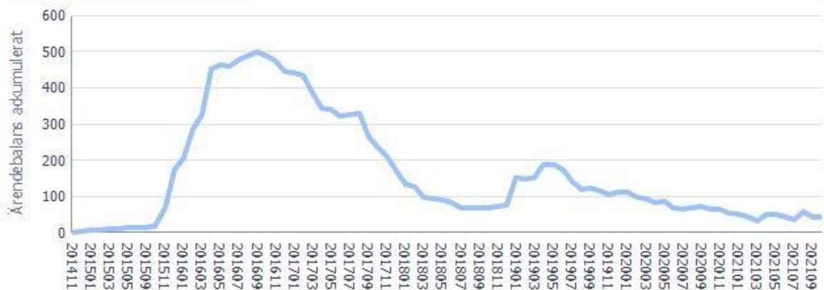
Figur 3 Ärendebalanser ackumulerat för ansökan

Ärendebalanser (antal ärenden) för ansökan om stöd inom Havs- och fiskeriprogrammet.